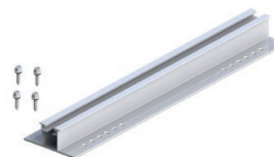
Puente para chapas trapezoidales 2.1

Para más información sobre otros artículos, consulte nuestro catálogo de productos o ingrese a nuestro sitio web www.alumerogroup.eu/es/