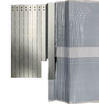
Ziegelsatzplatte rechts AS 2.1