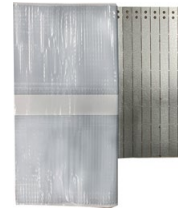
Ziegelsatzplatte links AS 2.1

weitere Artikel finden sie in unserem Produktkatalog oder auf unserer Website: www.alumerogroup.eu