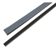
Fugendichtband 385mm und Kehlstreifen 250mm