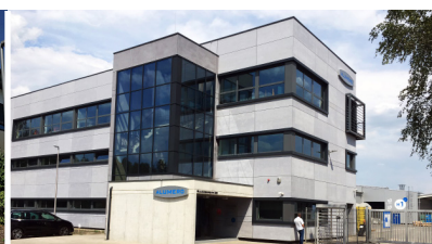
Sl. Bistrica, Slowenien