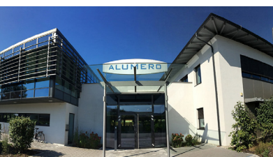
Headquarter, Seeham, Österreich